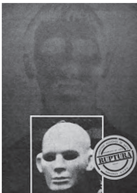
fig. 13. Portada del diario Ruptura , Santiago de Chile, 1982.

10. Si el activismo artístico logra abolir la distancia objeto-sujeto es, ni más ni menos, porque exige “poner el cuerpo” en la práctica.