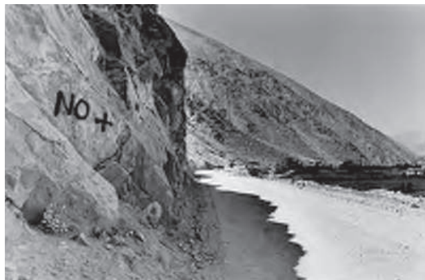
figs. 10-12. CADA, NO+, Santiago de Chile, 1983-1989.