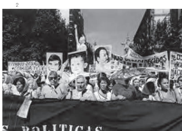
fig. 1. Silvio Zuccheri, fotografías de desaparecidos en pancartas. Buenos Aires, 1983.